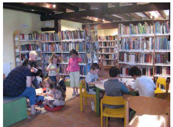
Un groupe d'enfants de l'école de Souesmes A la bibliothèque