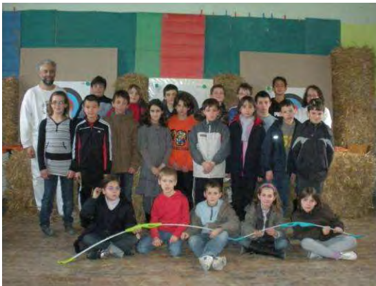
Initiation au tir à l'arc des 9 -12ans