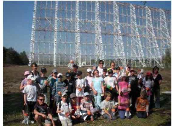
Sortie au Pôle des étoiles de Nançay